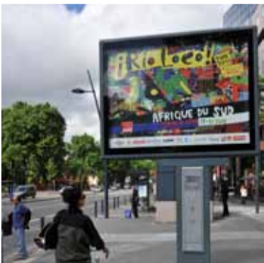
Le visuel 2010 créé par Cameron Platter