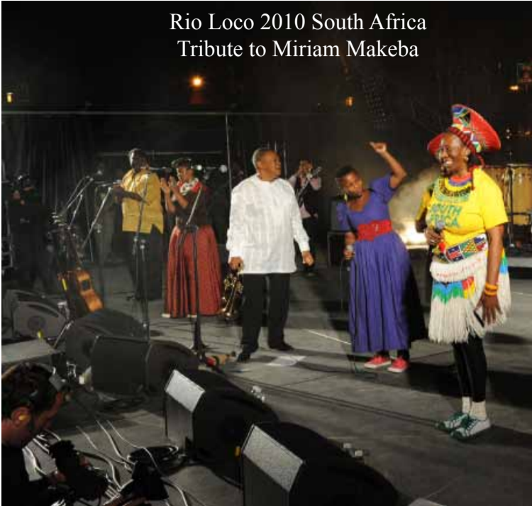
Rio Loco 2010 South Africa Tribute to Miriam Makeba